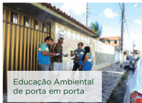
Educação Ambiental de porta em porta