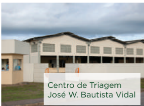
Centro de Triagem José W. Bautista Vidal