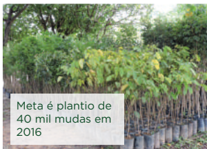
Meta é plantio de 40 mil mudas em 2016