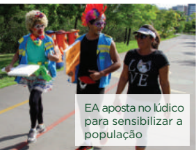
EA aposta no lúdico para sensibilizar a população